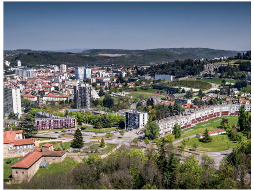
Vue de Firminy-Vert aujourd'hui (1961, architectes C. Delfante, J. Kling, M. Roux et A. Sive) et de la Maison de la Culture (1965, architecte Le Corbusier)